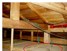
床下・天井裏はもっとも気になるけれども、見えない部分。築年数=建物の年齢ではありません。防水部を検査することで更なるあんしんをプラスします！