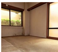
室内の天井、内壁。マンション外壁。プロの目からマンションにもあんしんをプラス。