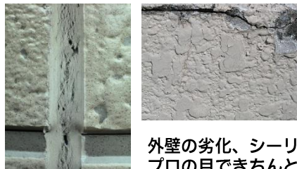
外壁の劣化、シーリングの劣化。プロの目できちんと検査いたします。