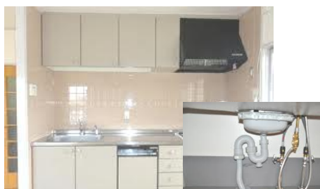
<+システムキッチン>